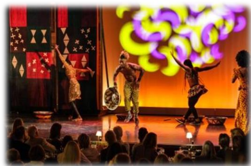
20198 – Charity for the project