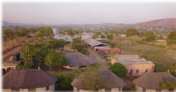
2019 – New partner CFL Liweitari