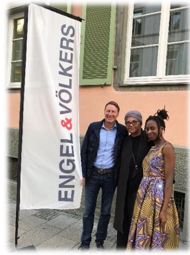
2019 – Engel und Völkers - major sponsor of the project